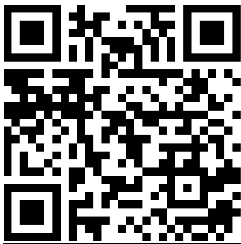
Kollégiumi jelentkezés SZÉCHENYIS diákok részére

A Kecskeméti SZC Széchenyi István Technikum koedukált kollégiumi elhelyezést biztosít lányok és fiúk részre. Az alábbi link, vagy QR kód segítségével jut el iskolánk honlapján a kollégiummal kapcsolatos információkhoz.